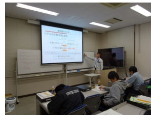
材料・表面処理の基礎の講義