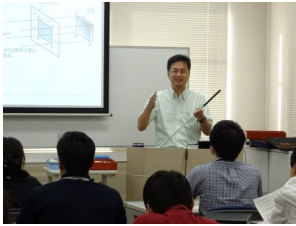
講師による製図講義、全て手書きでの実習、質問に講師が対応

機械設計の初心者を対象に、座学と実習(手書き製図)により、機械図面の基礎知識を学習する講座です。投影法、断面図や寸法の入力方などの製図の基礎知識、及び設計に必要な材料に関する基礎知識を学習します。