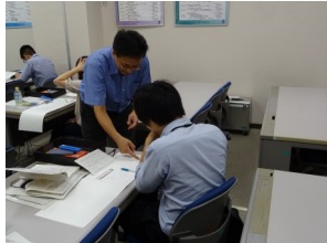
講師による製図講義、全て手書きでの実習、質問に講師が対応

機械設計の初心者を対象に、座学と実習(手書き製図)により、機械図面の基礎知識を学習する講座です。投影法、断面図や寸法の入力方などの製図の基礎知識、及び設計に必要な材料に関する基礎知識を学習します。