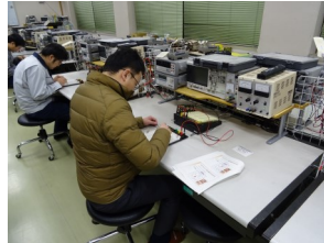
デジタル回路の演習