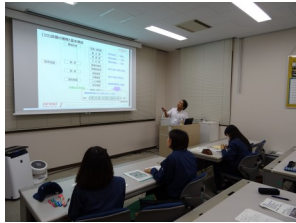
座学による生産・製造設備概論

未経験者向けに生産設備に使用されるPLC(プログラマブルロジックコントローラー)などの制御とプログラミング、空気圧制御やロータリーエンコーダの基礎を講義と実習により実践的に学習します。また、卓上型ロボットの操作を講座で体験し、その後、実際の産業用ロボットの見学を実施し、今後使われていくと予測されるロボットの知見を深めます。