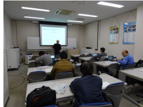
組み込みシステムの基礎