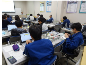
空気圧実験キットでの講座風景