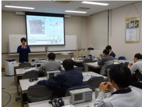
計測装置を使つての実習

生産・製造、保全の初級技術者が新たにコンピュータを利用した機器やシステムを取り扱う上で必要な電気・電子回路、デジタル回路の基礎を、講義と実験実習により実践的に学びます。 また、組み込みシステムの基礎技術を学ぶことで、業務改善のための基礎知識習得を目指します。また、各種センサーの仕組みや構造を体系的に学び、現在の動向から今後の技術まで、センサー活用に関する基礎知識を学びます。