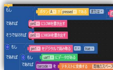
ブロックプログラミング(Scratch)