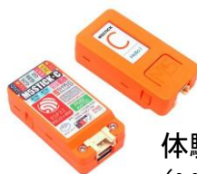
体験用機器 (M5 Stick C)