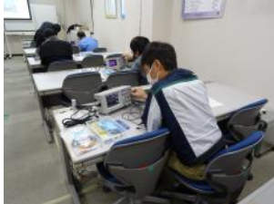
電子計測器による回路特性実験

生産・製造・保全の初級技術者が、電気回路などに広く用いられる低価格なセンサを取り扱う上で必要な電気・電子回路の基礎を、講義と実験実習により実践的に学びます。また、組み込みシステムの基礎技術を学ぶことで、現場で活用できる基礎知識の習得を目指します。さらには、IoTデバイスとクラウドとの連携、簡易型ロボットなどを体験することで、データの活用方法を体系的に学び、現在の動向から今後の技術まで、センサ活用に関して幅広く学びます。