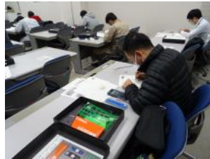
スケッチによる部品図作成