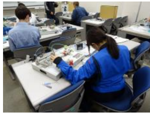
空気圧実験キットで実習