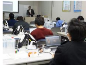
ロボット体験とIoTデータ活用