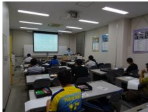
講師による製図講義、全て手書きでの実習、質問に講師が対応

機械設計の初心者を対象に、座学と実習(手書き製図)により、機械図面の基礎知識を学習する講座です。投影法、断面図や寸法の入力方などの製図の基礎知識、及び設計に必要な材料に関する基礎知識を学習します。