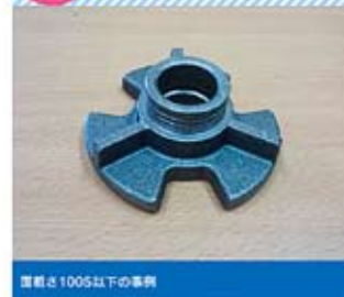
面粗さ100S以下の事例