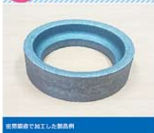
密閉鍛造で加工した製品例